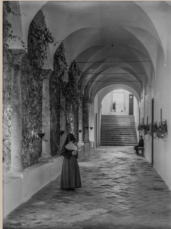
Claustro del Convento de la Merced

Modela la ropa con "su luz y sombra", adelantándose a lo que más tarde sería un refinamiento genuinamente sevillano en José Castellano, utilizando los aderezos propios nuestros: los encajes, abanicos, y todo con un frescor y genialidad sorprendentes. Para conseguir su fin, a veces no tendrá inconveniente en emplear los medios pictóricos como el carbón y el platino".